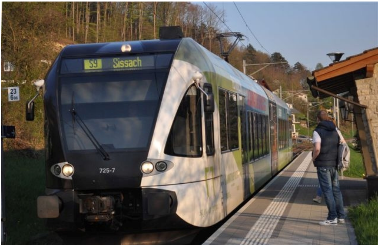
S 9 Halt Diepflingen